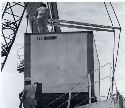
Het probleem van de sociale ongelijkheid wordt gesteld als een zaak van individuele kansen.

Wanneer er nu gesproken wordt over ongelijkheid van onderwijskansen, wordt er bedoeld: de naar sociaal milieu ongelijke deelname aan de verschillende vormen van onderwijs.